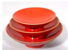
いっかけ 組盃 釦付 <本朱>3.3寸 5,140円 下段φ10cm