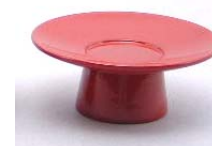
盃台(丸一文字) <黒・本朱・ため> 4,620円