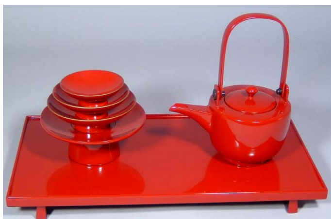
TS-6 <本朱>11.5縁付長角屠蘇器 無地 39,900円 台寸法: 35×18×3.5(cm)