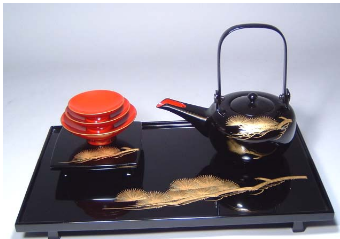
TS-26 <黒>12.0縁付屠蘇器 松風沈金 52,500円 台寸法: 36.5×23×3.5(cm)