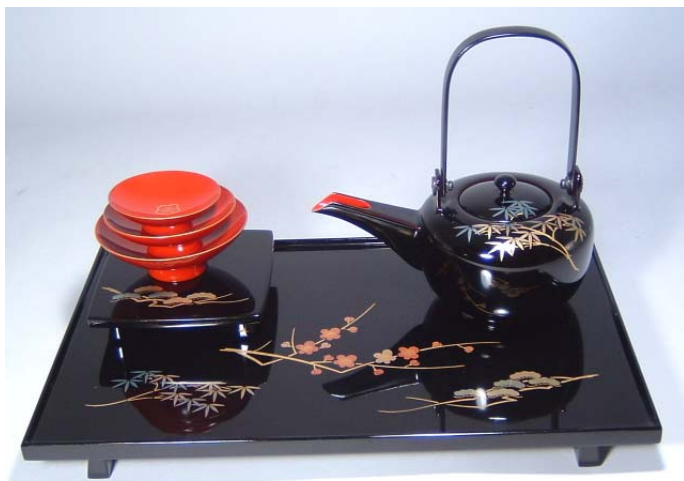
TS-24 <黒>12.0縁付屠蘇器 松竹梅 50,400円 台寸法: 36.5×23×3.5(cm)