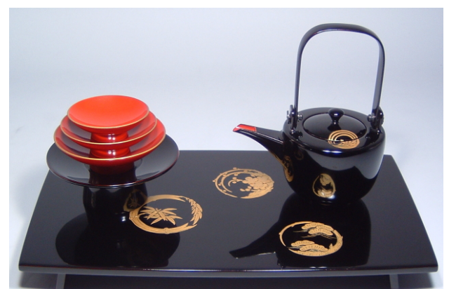
TS-23 <黒>12.0胴張屠蘇器 花丸 37,800円 台寸法:36×21×3.5(cm)