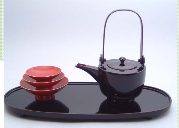
TS-4 <ため>11.5小判形屠蘇器 35,700円 台寸法:35×16.5×2(cm)