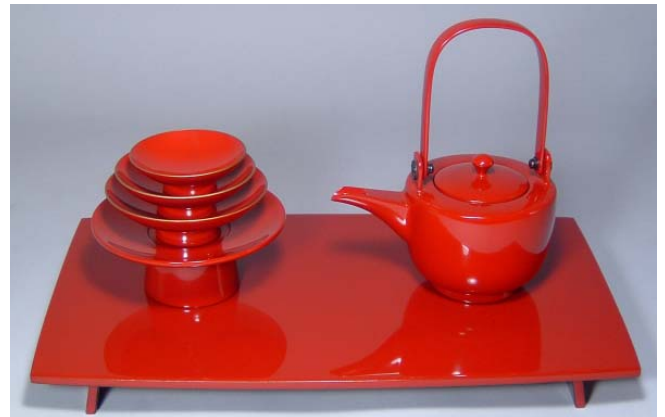
TS-13 <本朱>12.0胴張屠蘇器 無地 39,900円 台寸法:36×21×3.5(cm)