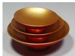
組盃 <本朱内金地> 3.6寸 10,500円 下段φ12cm