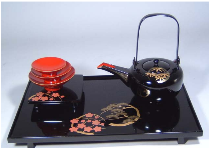
TS-25 <黒>12.0縁付屠蘇器 花丸松竹梅 52,500円 台寸法:36.5×23×3.5(cm)