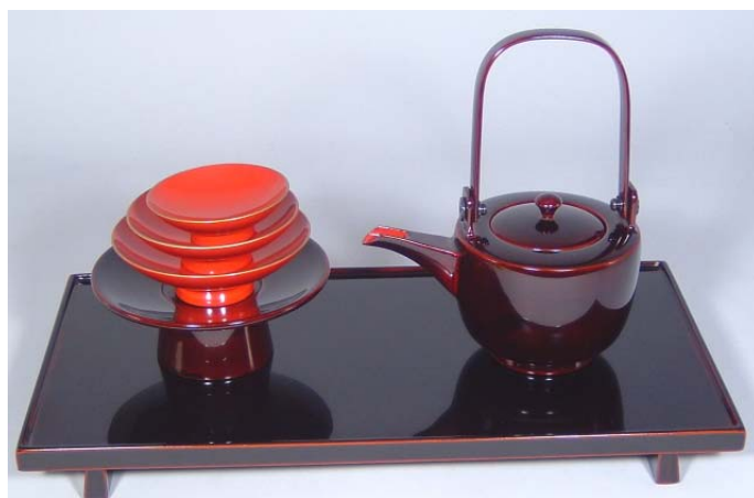
TS-4 <ため>11.5縁付長角屠蘇器 無地 39,900円 台寸法: 35×18×3.5(cm)