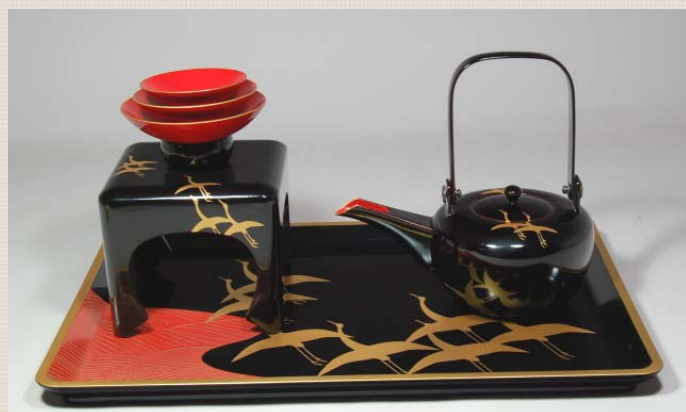
TS-42 <黒>13.0皿形屠蘇器 祥鶴 60,900円 台寸法: 39 × 27 × 2(cm)