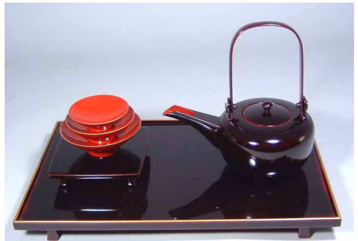
TS-28 <ため>12.0縁付屠蘇器 釦付 46,200円 台寸法:36.5×23×3.5(cm) 釦(いっかけ)とは金の縁取りのことを言います。