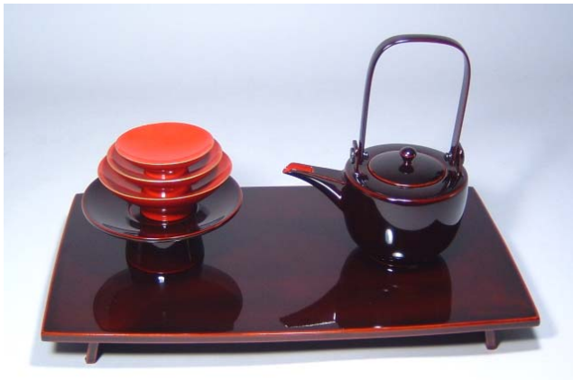
TS-8 <ため>12.0胴張屠蘇器 無地 37,800円 台寸法:36×21×3.5(cm)