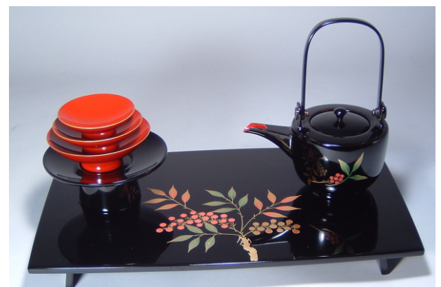
TS-21 <黒>12.0胴張四ツ揃屠蘇器 南天 37,800円 台寸法:36×21×3.5(cm)