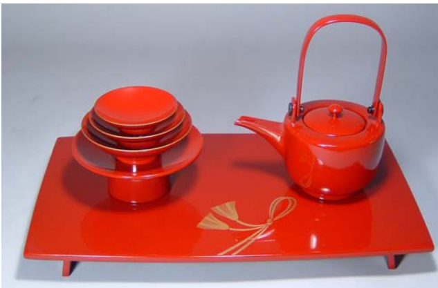
TS-14 <本朱>12.0胴張屠蘇器 結び文 42,000円 台寸法:36×21×3.5(cm)