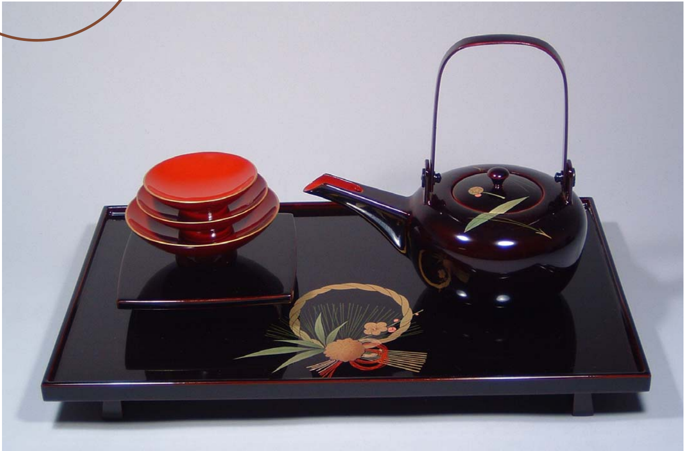
TS-65 <ため>12.0縁付屠蘇器 寿松竹梅 65,100円 台寸法:36.5×23×3.5(cm)

テーブルの上で気軽にお使いいただける屠蘇器です。 長方形の屠蘇台を立ち上がった縁が引き締めています。脚は二枚歯です。