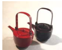
新白形銚子 <黒・本朱・ため> 16,800円