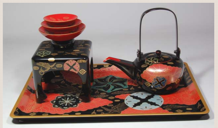
TS-43 <黒>13.0皿形屠蘇器 錦絵 67,200円 台寸法: 39 × 27 × 2(cm)