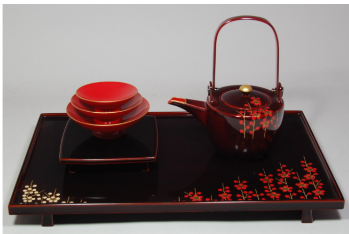
TS-29 <ため>12.0縁付屠蘇器 立梅(たちうめ) 48,300円 台寸法: 36.5×23×3.5(cm)