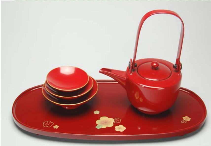
TS-66 <本朱>11.5小判形屠蘇器 福梅 38,850円 台寸法:35×16.5×2(cm)

現代的なお住まいにあった屠蘇器です。 楕円型のお盆に銚子と金の縁取りの盃のみ。 <本朱>のかわいい福梅、シックなくため> の他に、<本朱>無地のご用意もございます。