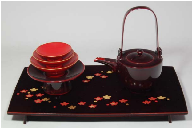
TS-11 <ため>12.0胴張屠蘇器 小梅散し 37,800円 台寸法:36×21×3.5(cm)