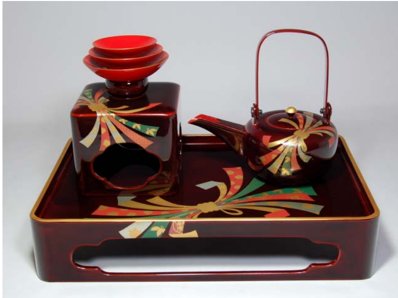
TS-36 <ため>鉢台形屠蘇器 彩絵束のし 96,600円 台寸法: 37.5 × 25 × 7.5(cm)