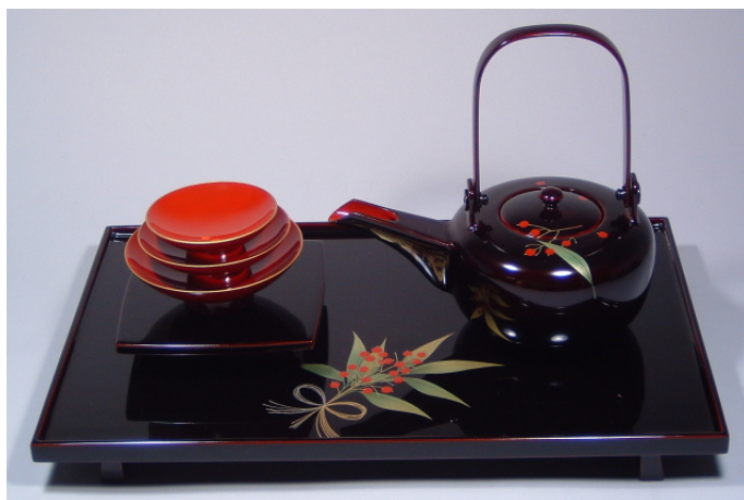
TS-64 <ため>12.0縁付屠蘇器 水引南天 56,700円 台寸法: 36.5×23×3.5(cm)