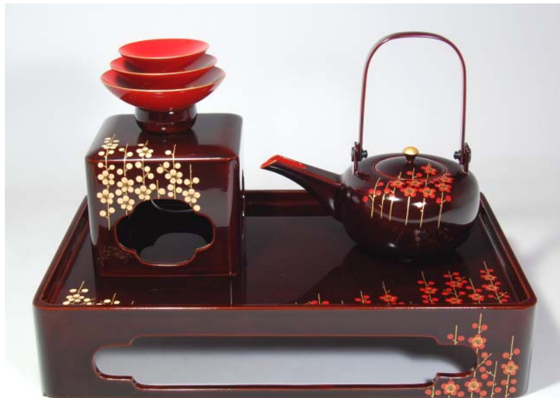
TS-38 <ため> 鉢台形屠蘇器 立梅 73,500円 台寸法: 37.5 × 25 × 7.5(cm)