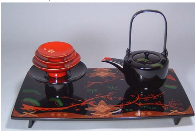
TS-19 <黒>12.0胴張四ツ揃屠蘇器 会津絵 42,000円 台寸法:36×21×3.5(cm)