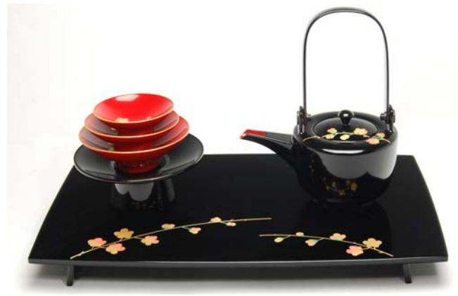
TS-65 <黒>12.0胴張屠蘇器 寿金紅梅 37,800円 台寸法:36×21×3.5(cm)