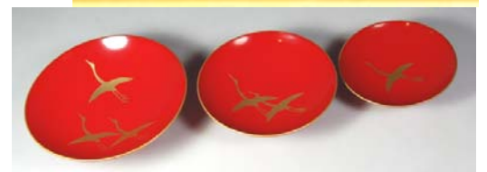
TS-35 <ため> 12.0鉢台形屠蘇器