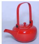
丸形銚子 <黒・本朱・ため> 16,800円