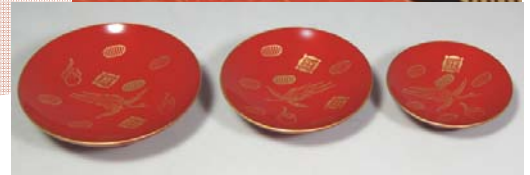
TS-32 <黒> 鉢台形屠蘇器 祥鶴